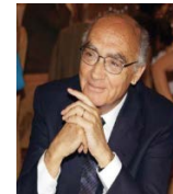
José Saramago prix Nobel

Langue d'art, de littérature, de poésie, de musique et de cinéma