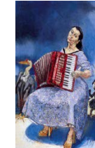
Tableau de Paula Rego